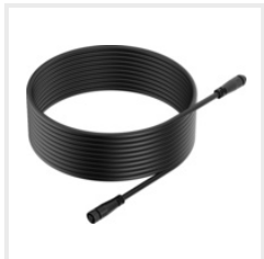
Verlängerungskabel für Batterieladegerät (RR-8060022) CHF 49.00