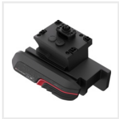
PreciEdge Schneidemodul für 4WD (RR-8060004) CHF 149.00