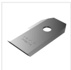
Ersatzmesserset Plus (RR-8060013) CHF 24.00