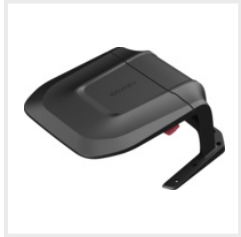
Garage (RR-8060029) CHF 149.00