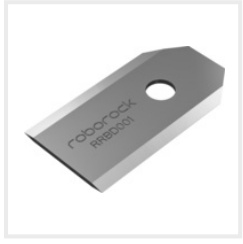
Ersatzmesserset (RR-8060012) CHF 19.00