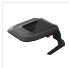
Garage Glossy Version (RR-8060030) CHF 199.00